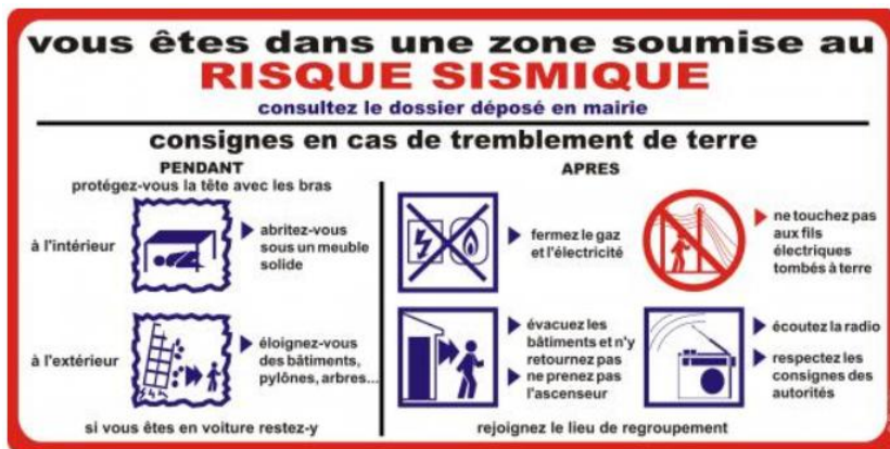
Document 1 : Consignes de sécurité distribuées à la population